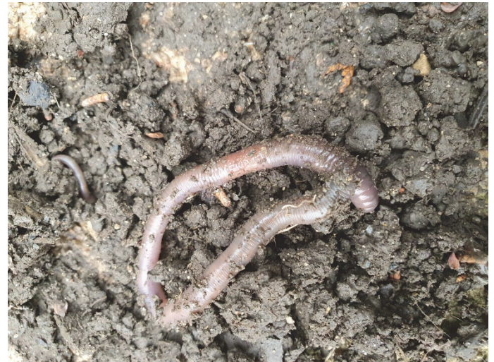
Regenwurm im Boden; Fotografie: Geschäftsstelle Biosphärengebiet Schwäbische Alb

Bei Fragen hilft das Team des Biosphärenzentrums Schwäbische Alb unter Telefon 07381 932938-31 von Dienstag bis Sonntag von 10:00 bis 18:00 Uhr gerne weiter. Die Veranstaltung ist Teil des Jahresprogrammes des Biosphärenzentrums Schwäbische Alb. Das komplette Programm und weitere aktuelle Informationen sind online unter https://www.biosphaerengebiet-alb.de/veranstaltungen#/event abrufbar.