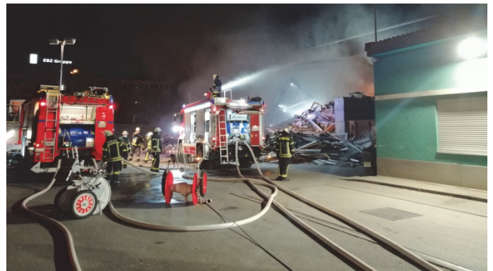
Feuerwehr bei einem Löscheinsatz

Übersicht der Projekte, bei denen die Zuschussbewilligung durch das Regierungspräsidium Tübingen erfolgt ist.