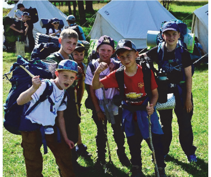
Abenteuer für Jungs beim Zeltlager an der Weidacher Hütte.

Wir informieren finanziell schwächere Familien gerne über Zuschussmöglichkeiten. Alle weiteren Infos über diese und weitere Freizeiten sowie die Anmeldemöglichkeit gibt es auf www.ejgp.de/freizeiten