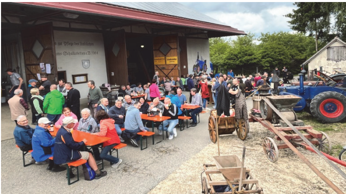
Vor dem Museum ist jeder Platz von den Besuchern belegt

Äußerungen einzelner Besucher bestätigen, dass der Tag der offenen Tür im Museum zusammen mit den gesamten Rahmenaktivitäten und Attraktionen für die Besucher ein voller Erfolg ist. Die Hefeknöpfe aus der Grombiera Dämpfe sind so gut gelungen, dass es die Gäste besonders begeistert.