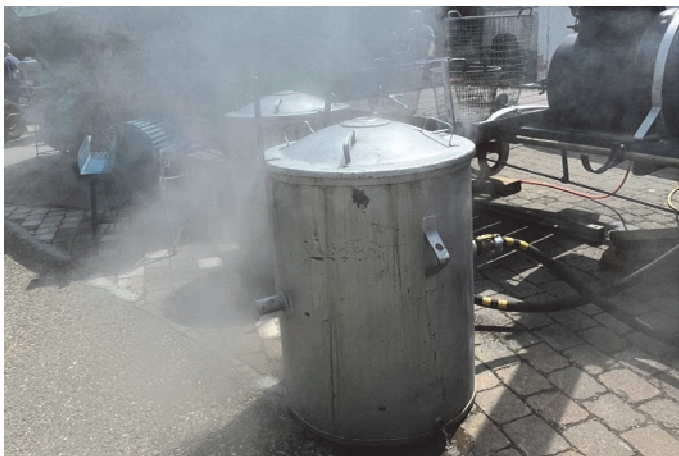
Der Dampf aus der Grombiera Dämpfe sorgt für eine mystische Stimmung