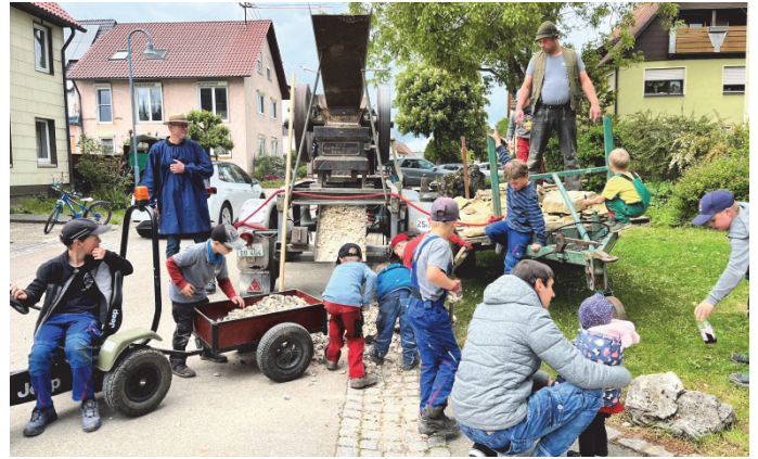
Jugendliche am Steinbrecher in vollem Einsatz