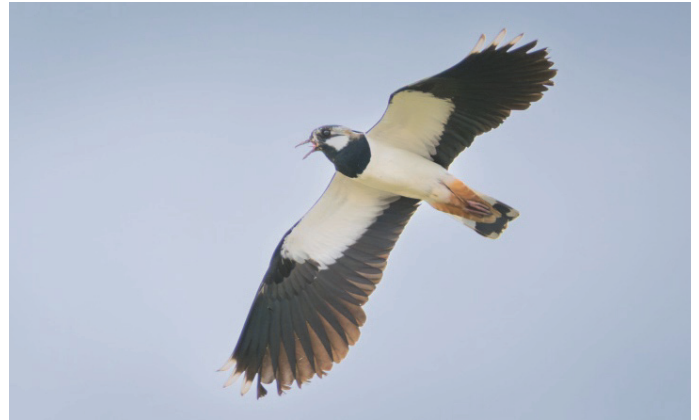
Kiebitz im Flug