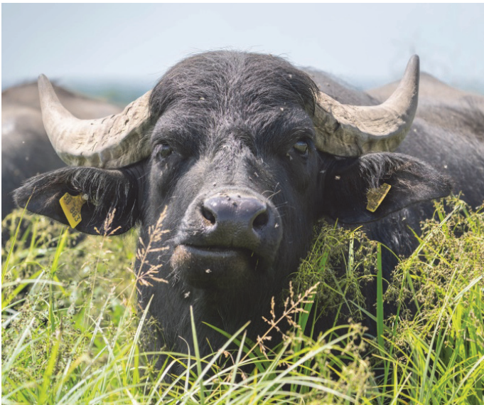
Wasserbüffel; Fotografie: Josef Grom

Der Erfolg ließ nicht lange auf sich warten: Auf den neu geschaffenen, weitgehend offenen Flächen, wurden Mitte März, das erste Mal seit mindestens 70 Jahren, wieder balzende Kiebitze gezählt. Ab Mai kommen dann erstmalig Wasserbüffel auf die Fläche, um als „Landschaftspfleger“ dafür zu sorgen, dass die Gehölze nicht überhandnehmen und die Wasserflächen erhalten bleiben.