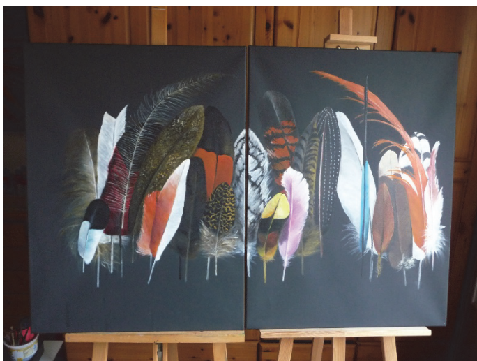
Federparade, Foto: Elisabeth C. Sauber

Phantastische Bilder aus Federn – echten und gemalten – können Besuchende ab Mittwoch, 2. April 2025, im Biosphärenzentrum Schwäbische Alb in Münsingen-Auigen bestaunen. Zu sehen sind die Werke der Künstlerin Elisabeth C. Sauber bis 15. Juni 2025 jeweils mittwochs bis sonntags von 10:00 bis 18:00 Uhr.